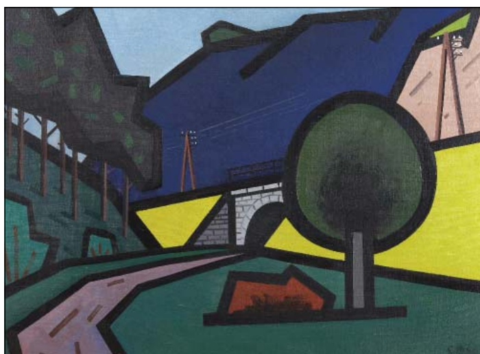
Eduard Stavinoha: Trať Prokopským údolím, 1967

Nezávislý čtvrtletník, vycházející ve spolupráci se Společností proti developerské výstavbě v Prokopském údolí